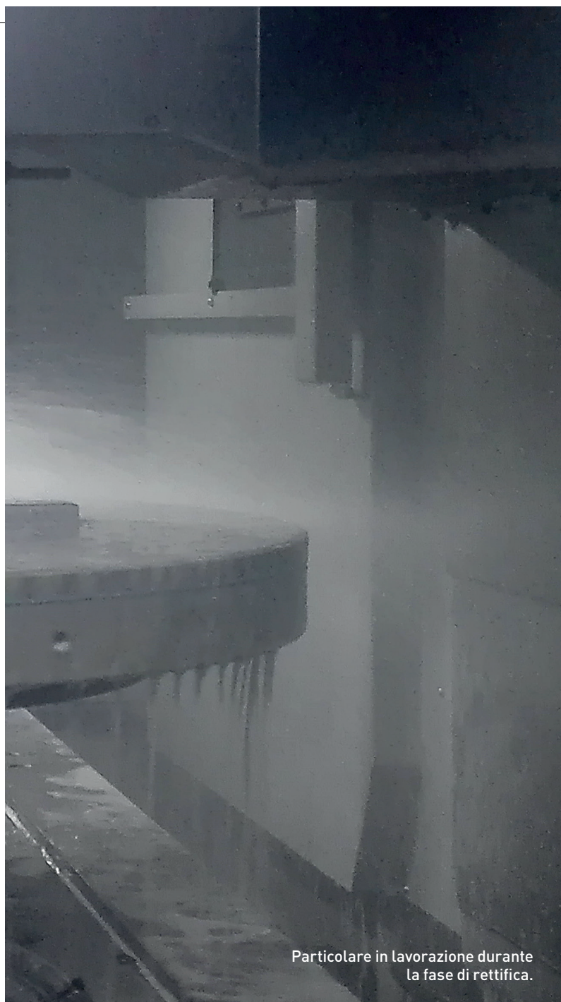
Particolare in lavorazione durante la fase di rettifica.